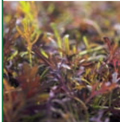
Baby Roter Mizuna