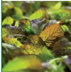
Baby Roter Senf