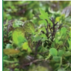
Micro Leaf Mix