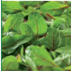
Baby Roter Mangold