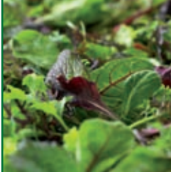
Baby Leaf Mischung