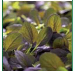
Baby Roter Tatsoi